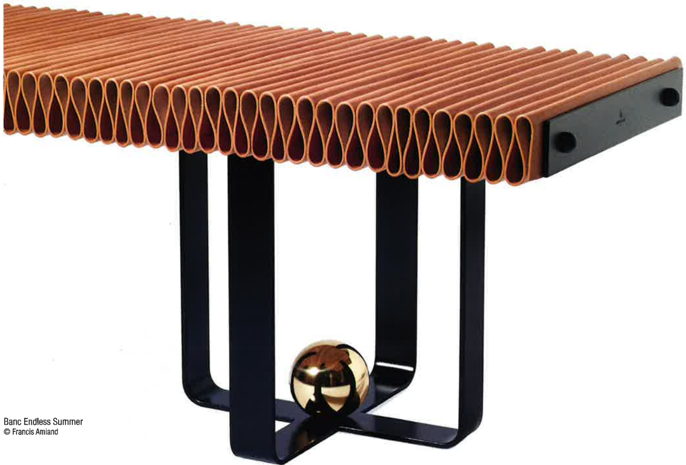
Banc Endless Summer

structure, leurs éléments... Puis sur les chantiers, j'ai rencontré les vrais artisans : je voyais les staffeurs travailler le plâtre avec leurs mains, faire des moules, les Compagnons façonner sur place les éléments. J'étais stupéfait. C'est vraiment là que j'ai développé cette appréciation pour l'artisanat d'art français. C'est vraiment unique au monde. Je m'appuie beaucoup sur la créativité des artisans et des fournisseurs avec qui je collabore.