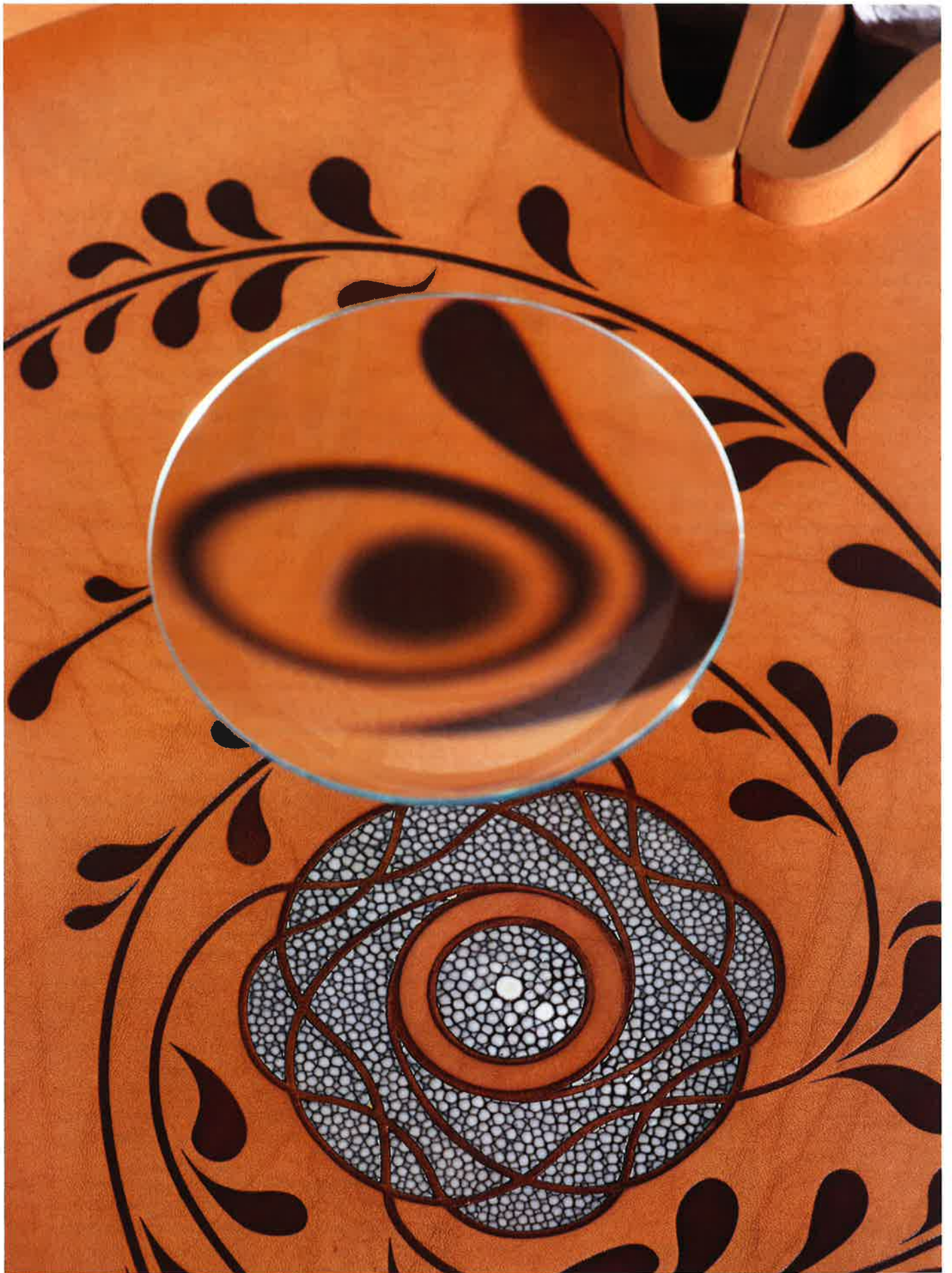
Table Écume © Francis Amland